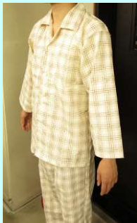
パジャマ (ハーフ・ジュー)