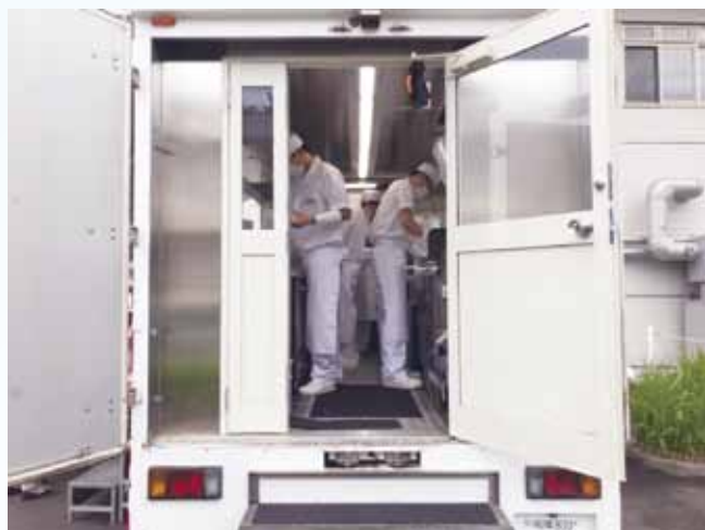
職人さん4人体制で作っています