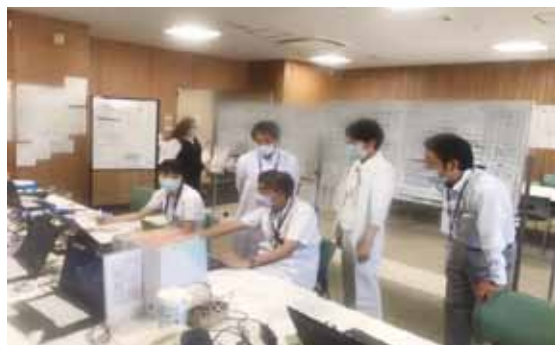
C：新型コロナウイルス対策本部での様子

そして感染管理認定看護師は関連組織と協働してパンデミック (世界的大流行) や災害等の緊急事態を想定した準備と対応も行っています。当院においては現在、新型コロナウイルス対策本部が設置され、災害モードで対応しております。(写真C)