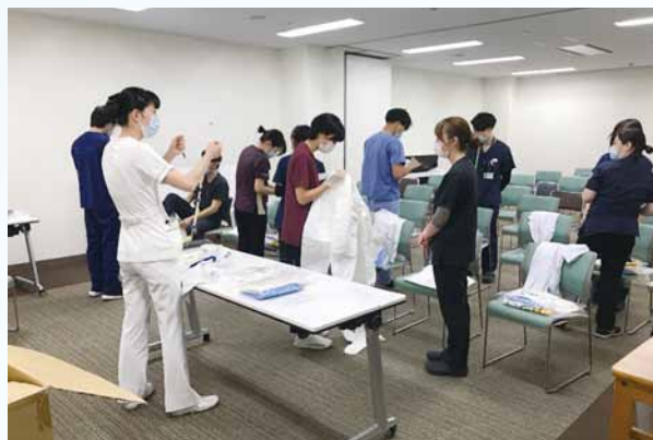
A：スタッフへの个人防护具着脱訓練の様子

「感染管理認定看護師」の主な活動はまず、当院の現状を把握して評価し医療関連感染予防・管理システムを構築することです。手指衛生の状況や環境整備の方法など日々の感染予防対策を評価して見直します。そして数値化して見える化し関連部署に改善策を求め、再構築を目指しています。