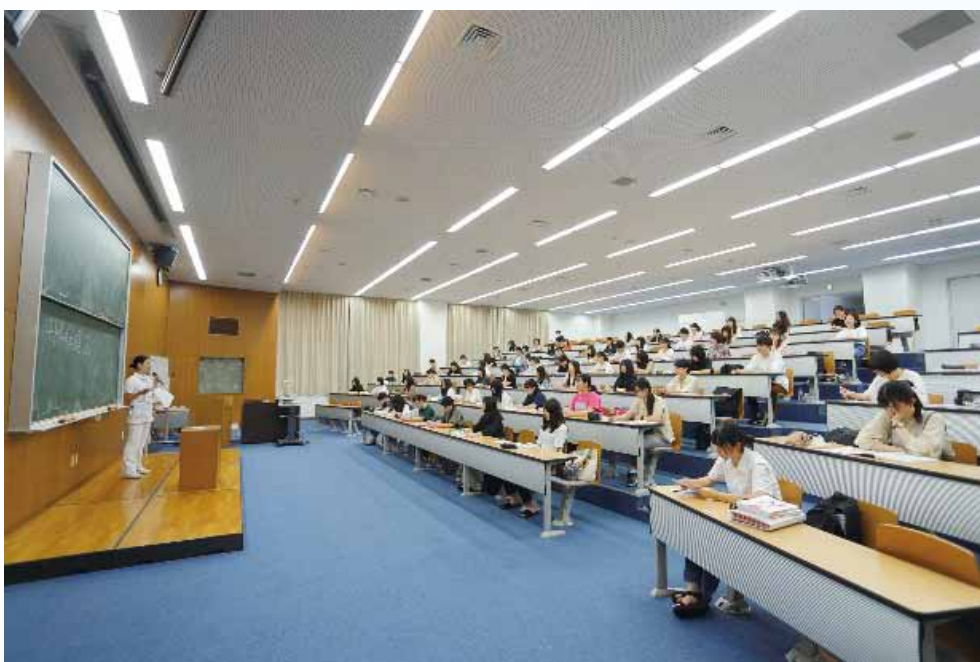
フィジカルディスタンスを保って授業を受ける

多くの患者を受け入れながら学校教育に積極的で寛大な学校長、柔軟性と創造性豊かな教員の力で第1波を乗り切ることが出来そうです。学生と保護者の協力にも感謝します。次の感染症と勇敢に戦える看護師を育成するため、目の前に学生が居ることに感謝しながら教壇に立ち続けたいと思います。