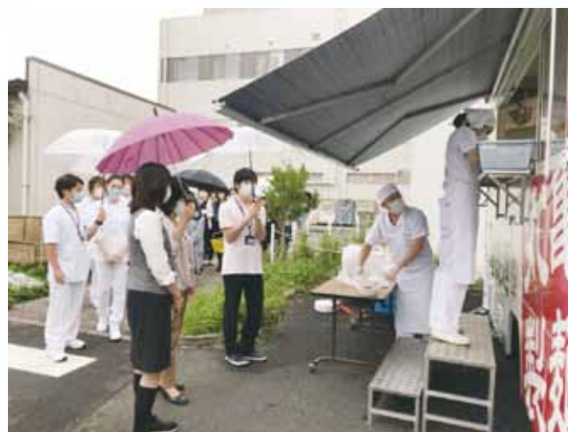
雨にもかかわらず、大盛況

緊急事態宣言解除後ですが、当院では「新型コロナ対策本部」を中心に、奮闘する日々が続いています。多くの職員が「出来たてうどん」を楽しみに、昼休憩時に並んでいる姿が見られました。