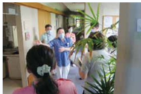
B：福祉施設での指導の様子

スタッフや利用者さんの行動や動線、物品保管状況などを踏まえてその福祉施設に沿った感染対策が実行できるよう共に考え改善策を提案しています。感染管理認定看護師は当院だけではなく地域と一丸となって感染対策に努めています。