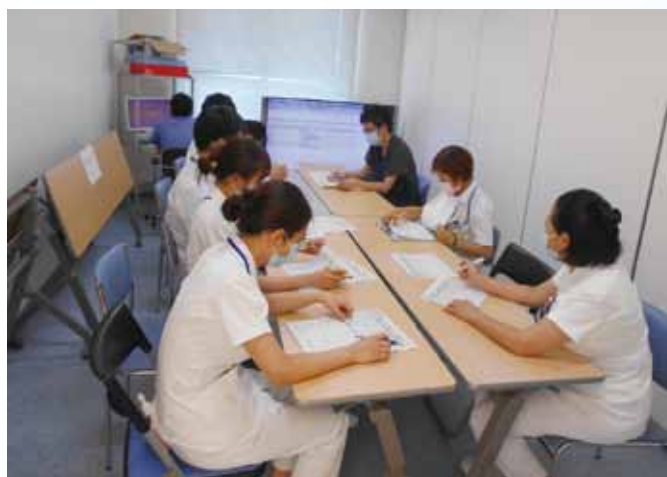
糖尿病チームカンファレンスの様子

当院では、今年度から糖尿病教育入院パスに、ストレスを同定する質問票を導入致しました。患者さんの様々な感情を読み取り、糖尿病がどの程度、心の負担になっているかを評価し、家族も含め、患者さんが「引き受ける、受け入れる、納得する」、そして、うまい付き合い方を探せるように、サポートしていきます。引き続き、糖尿病医療連携において貢献できるよう、糖尿病チームケアユニット一同、努力致します。